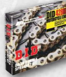
JAPAN CHAIN KIT

Bộ sên nhông đĩa sử dụng phốt cao su chữ T do DID phát triển. Nó có thể được sử dụng lâu hơn phiên bản HDN.