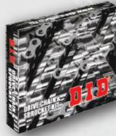
VIX CHAIN KIT

Tăng độ dày của má sên từ DXN. Bộ nhông sên đĩa có độ bền cao hơn.