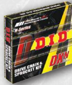
DXN CHAIN KIT

Bộ nhông sên đĩa phổ biến nhất của DID. Tiết kiệm chi phí và nhẹ.