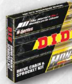
HDN CHAIN KIT

Bộ nhông sên đĩa phổ biến nhất của DID. Tiết kiệm chi phí và nhẹ.